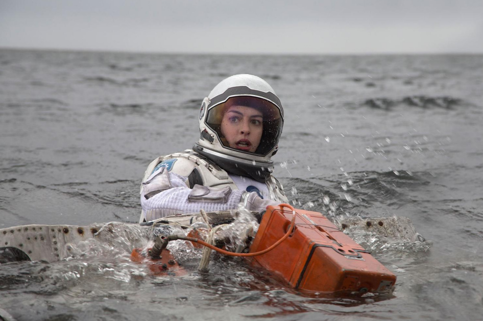
La astronauta y biotecnóloga Amelia Bran, interpretada por Anne Jacqueline Hathaway en Interstellar , tras amerizar en un planeta similar a la Tierra en el que se producen maremotos de enormes dimensiones

inteligente en otros mundos fue el flechazo que le metió el veneno de la astronomía en la sangre.