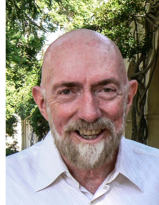
Kip Thorne fotografiado en 2007 en el Caltech, donde ocupó la cátedra «Profesor Feynman» de Física Teórica hasta que se jubiló en 2009

En Interstellar , ante el imparable deterioro de los ecosistemas terrestres, a la Humanidad sólo le queda una última esperanza para sobrevivir: encontrar un hogar alternativo en el Cosmos, un «planeta B» habitable. De nuevo, a muchos espectadores semejante idea quizás les suene a pura ciencia ficción. Sin embargo, una de las mentes más brillantes de nuestro tiempo, Stephen Hawking, ha defendido recientemente la necesidad de seguir apostando por la exploración espacial, precisamente para garantizar la futura supervivencia de nuestra especie. En una entrevista 2 que le hice poco antes del estreno de la película, el astrofísico británico explicaba con estas palabras por qué, en su opinión, merece la pena invertir miles de millones en el desarrollo tecnologías cada vez más potentes para viajar al Cosmos: «Podría evitar la desaparición de la Humanidad gracias a la colonización de otros planetas». El autor de obras tan importantes y populares como Historia del Tiempo y El gran diseño considera que en un mundo amenazado por peligros como el cambio climático o la posibilidad de un conflicto nuclear, «la raza humana no debería poner todos sus huevos en la misma cesta, o en el mismo planeta; esperemos poder evitar que la cesta se caiga antes de haber esparcido la carga». De hecho, no me cabe duda de que el profesor Hawking suscribiría la visión del astronauta Cooper, el personaje que interpreta Matthew McConaughey en Interstellar , cuando le dice